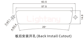
板后安装开孔 (Back Install Cutout)